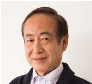
「企業様 CS向上ご担当役員様